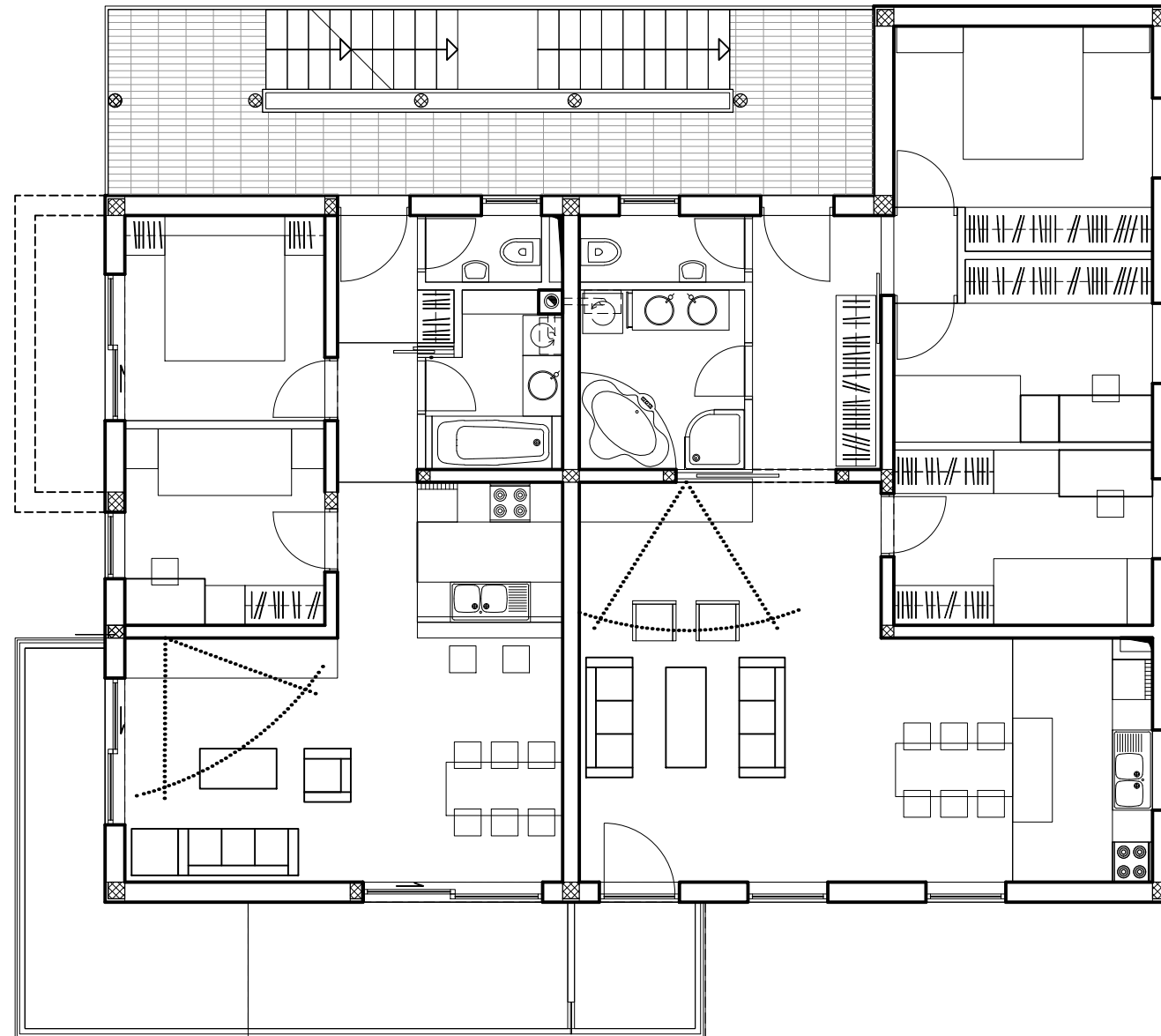
VILA C_TLOCRT 1. KATA