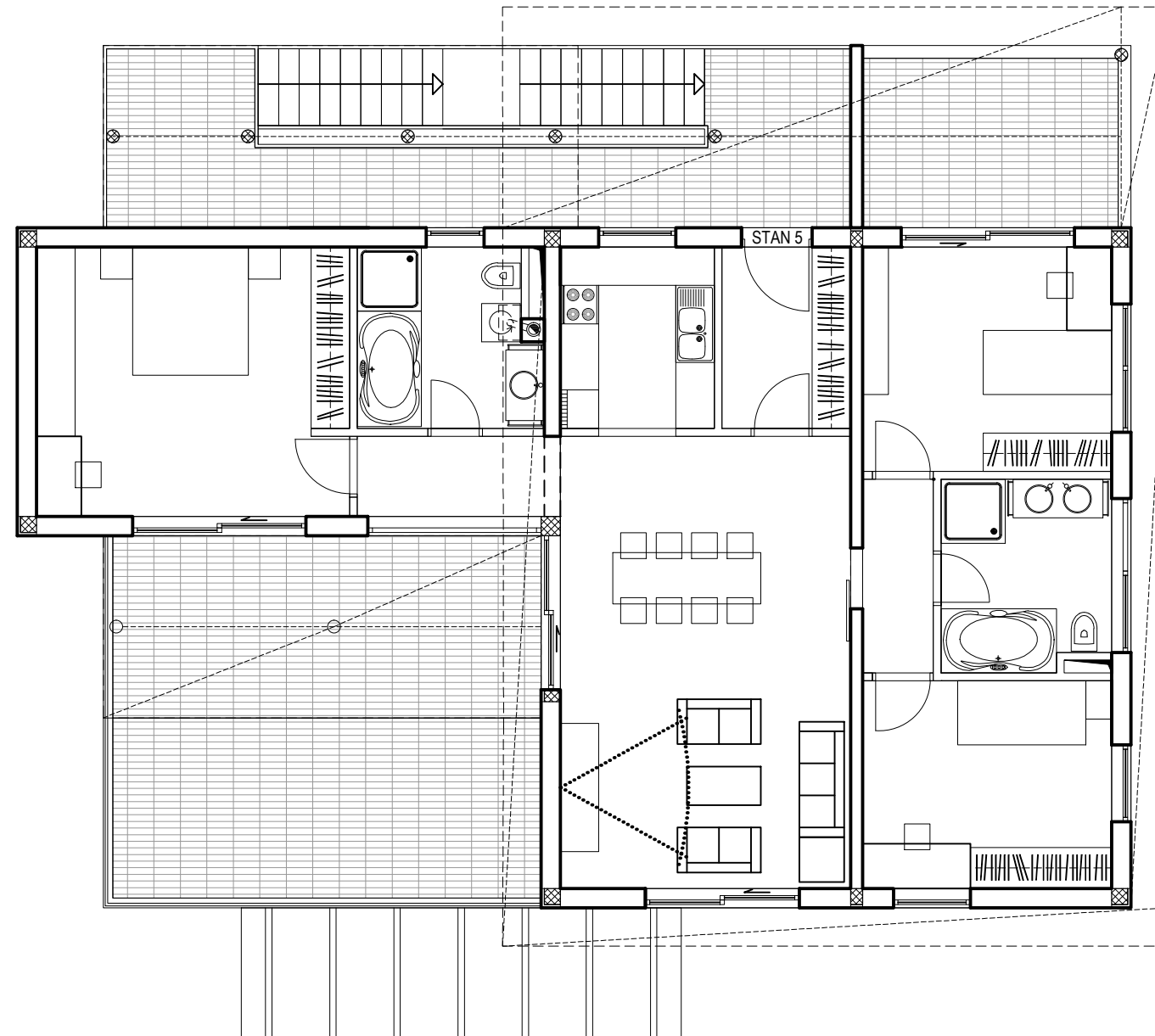
VILA C_TLOCRT POTKROVLJA